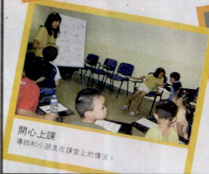
開心上課 導師和小朋友在課堂上的情況。