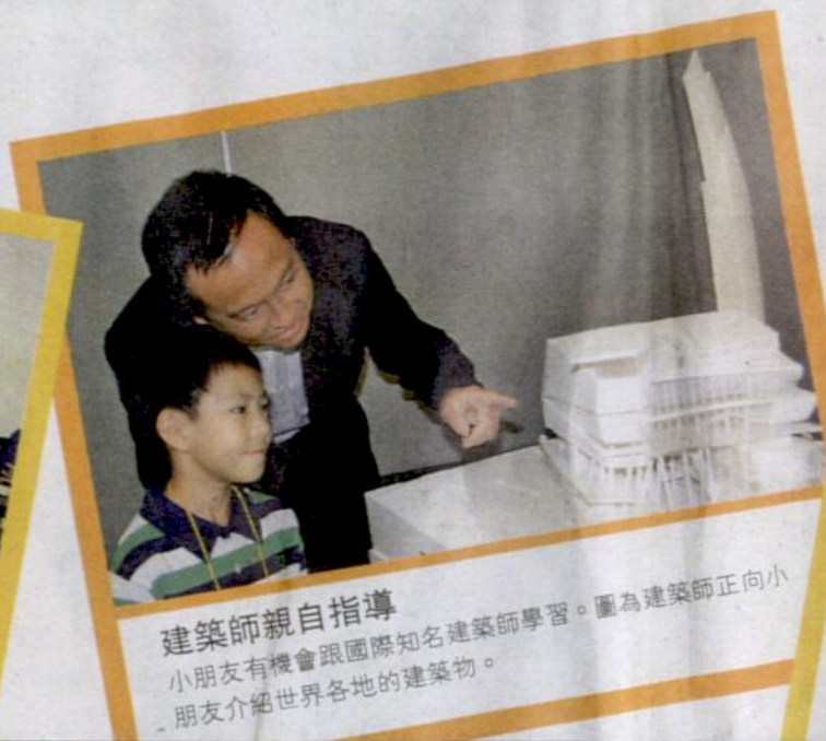
建築師親自指導 小朋友有機會跟國際知名建築師學習。圖為建築師正向小朋友介紹世界各地的建築物。