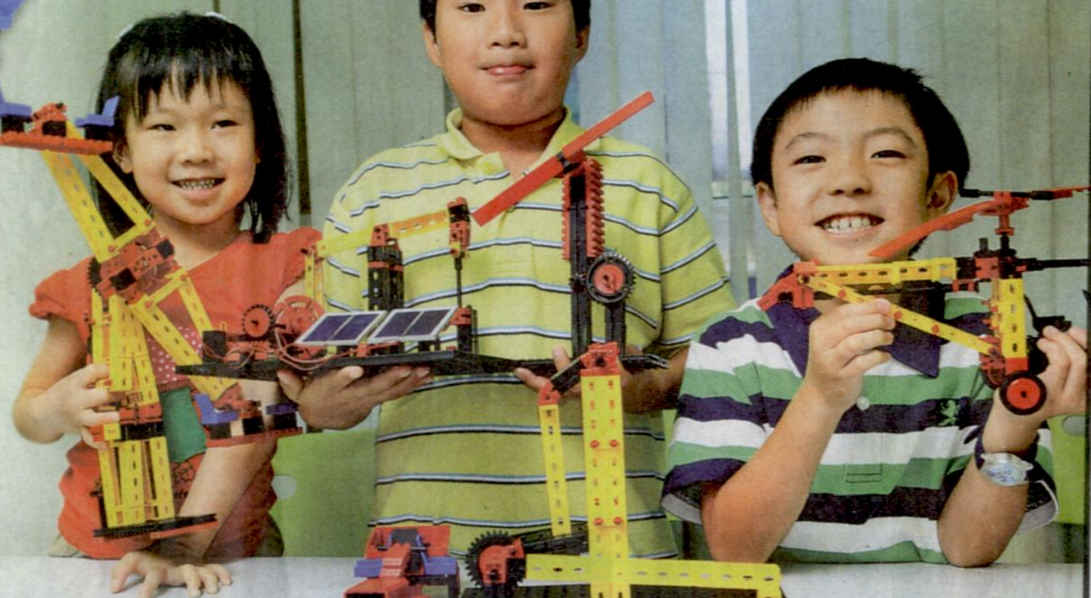
「Fischertechnik 德國慧魚積木」除可砌出建築物、交通配套設施和城市規劃外，也可利用它們介紹物理現象。